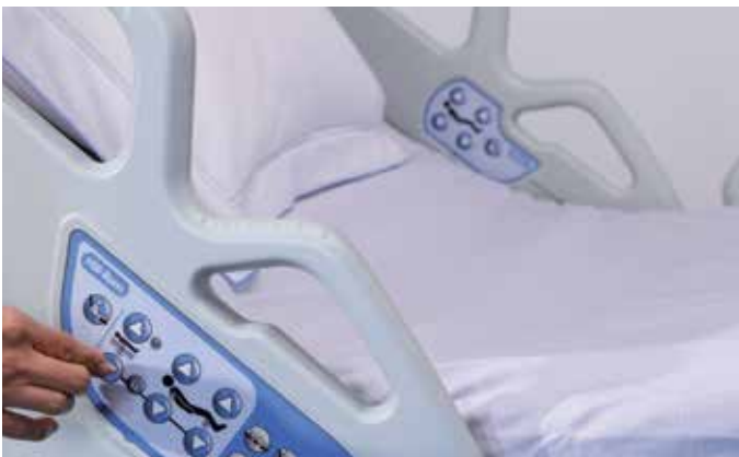
Poignée assurant une bonne prise en main et commandes intégrées