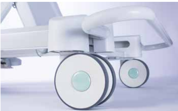
Roues double galets, diamètre 125 mm, en option **