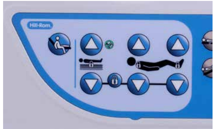
Indicateur de position basse et positionnement de sortie de lit à commande unique