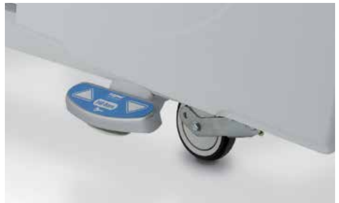
Pédale de commande de hauteur variable sur les deux côtés (en option) avec verrouillage automatique et 5ème roue directionnelle