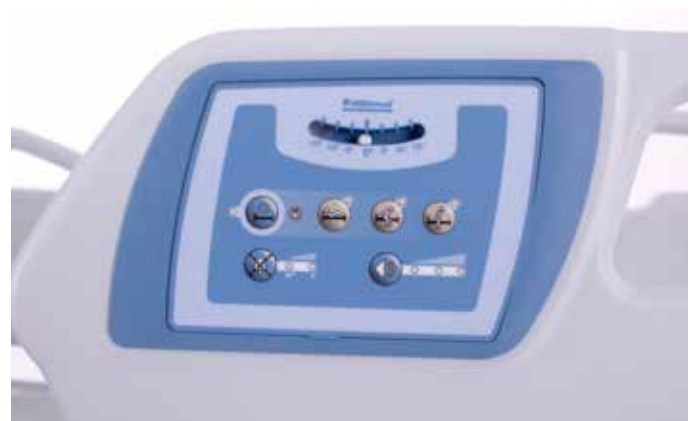
Alarme de sortie de lit à 3 modes