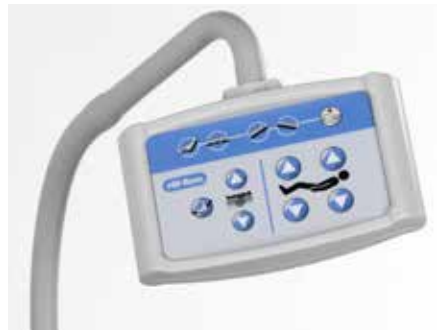
Commande sur bras flexible*