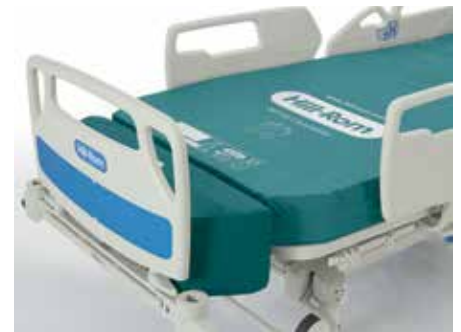
Rallonge-matelas en mousse avec housse soudée AD231A-07

Pour confirmer quels versions d'accessoires vont avec votre modèle de lit, merci de noter le numéro de série du lit : HRPXXX, et contacter votre représentant local.