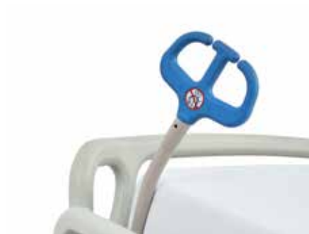
Gestionnaire de tubulures