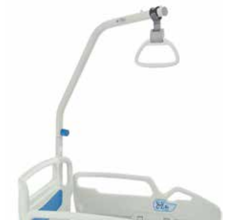
Potence fixe (light grey)