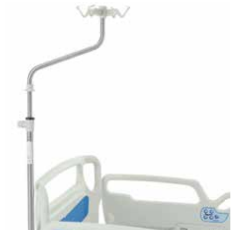
Tige porte-sérum droite de hauteur fixe 4 crochets