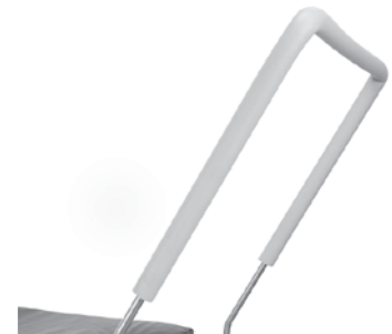
Barre de travail P3613B