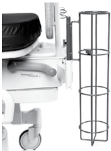
Porte-bouteille d'oxygène P27601