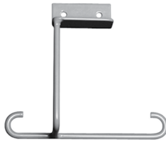
Support pour poches urinaires P3623