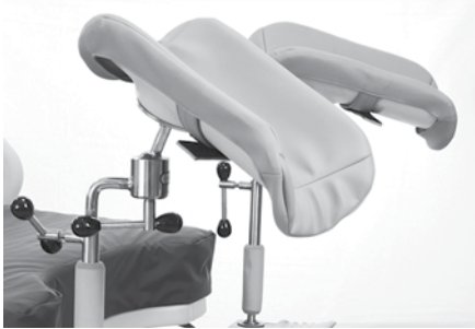
Repose-mollets télescopiques P35745A