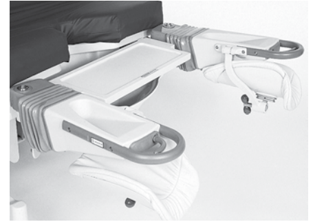
Plateau pour instruments (versions Lift Off) P278B