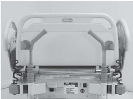
Poignées de transport ergonomiques avec supports de tige porte-sérum intégrés et galets pare-chocs P1983A01