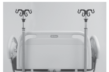
2 tiges porte-sérum fixes (pliables) P3732A