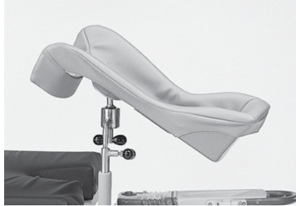
Repose-jambes télescopiques P7634C