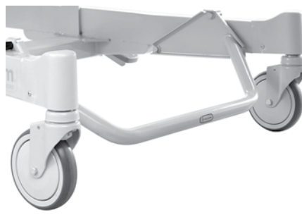
Barre repose-pieds (Lift Off uniquement) P451A