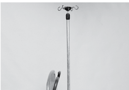
Tige de transfert ISS P158A